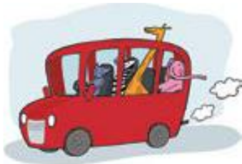
kočii ili ubrzava

Prema položaju žirafine glave na slici odredite ubrzava li autobus ili kočii. Sliku spoji s točnom tvrdnjom.