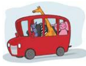
kočii ili ubrzava